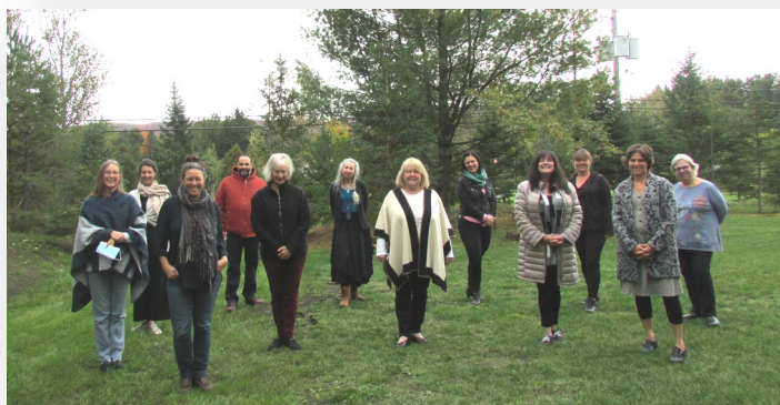
Partenaires du MOCAS des Pays-d'en-Haut